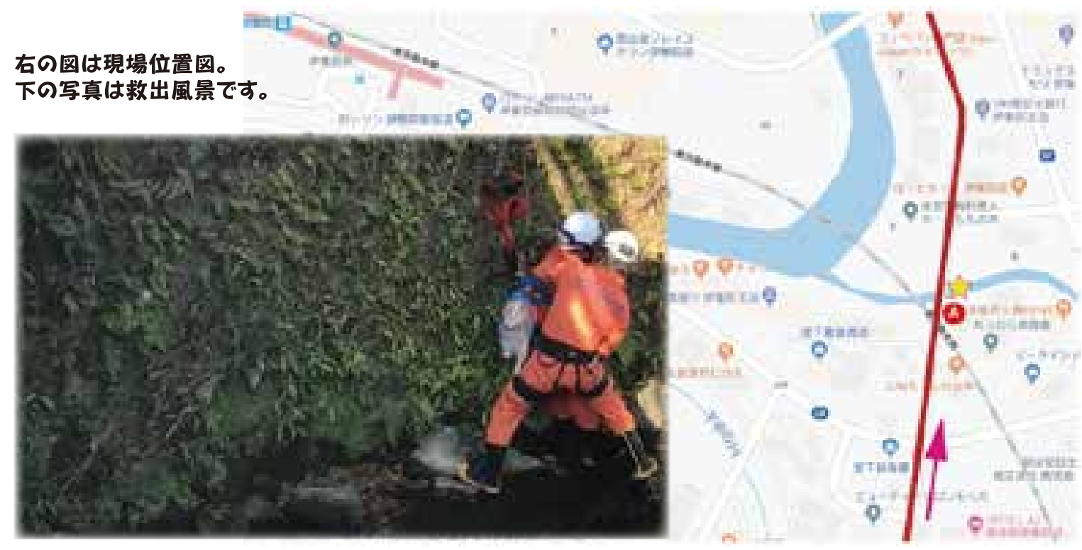
右の図は現場位置図。下の写真は救出風景です。

図は赤い線が作業区間の一部。A地点が作業車のセット場所。★マークが犬の発見場所。