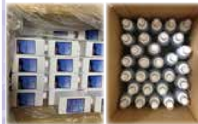
アスファ水出荷の様子・・・